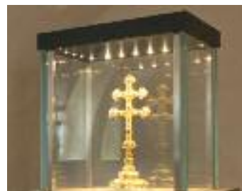
Das Zawischkreuz in Kloster Hohenfurth (Vyšší Brod)

Einblicke in die Landschaft und Eindrücke über die Bewohner lassen sich am besten mit dem Auto oder dem Fahrrad sammeln, vielleicht auch mit einem Elektro-Auto, buchbar ab Linz oder einem E-Bike, buchbar vor Ort in Bad Leonfelden oder Freistadt.