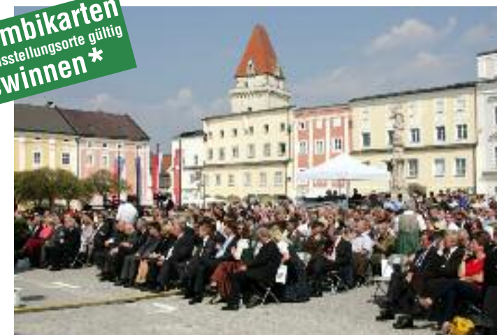
Über 1500 Gäste verfolgten die Eröffnungsfeier am Stadtplatz in Freistadt.

Der aus zwei Bänden bestehende Katalog zur Landesausstellung vereint alle Themen der vier Ausstellungsorte. Der Leser erfährt interessante Details über die Besonderheiten des Natur-