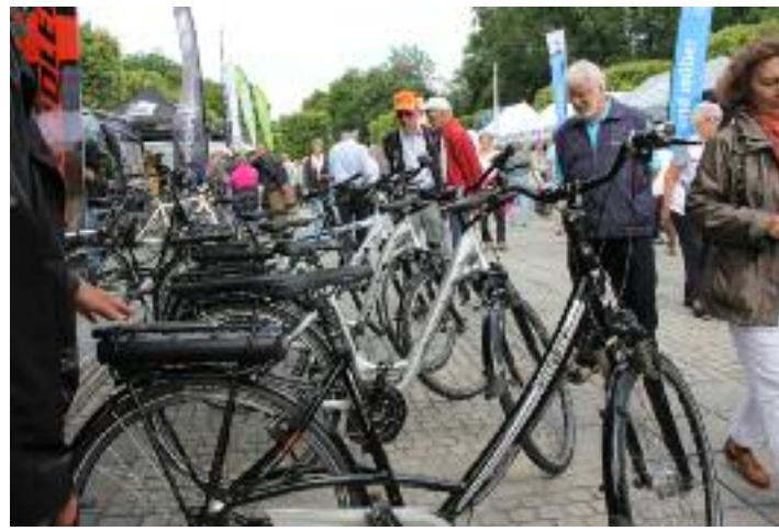
E-Bikes und Pedelecs, Fahrräder mit elektrischem Zusatzantrieb, sind in Bad Füssing die großen Renner bei den Gästen. Die jährlichen E-Mobilitäts-Tage ziehen Hunderte von Interessenten an. Termin der E-Mobilitäts-Tage 2013 sind der 11. und 12. Juni.

beim Treten unterstützt. Der niederbayerische Kurort Bad Füssing wurde in den letzten Jahren zu einer Hochburg für den „Radspass mit elektrischem Rückenwind“. Mittlerweile warten bereits mehr als 100 Leih-E-Bikes in Bad Füssing auf komfortorientierte Gäste.