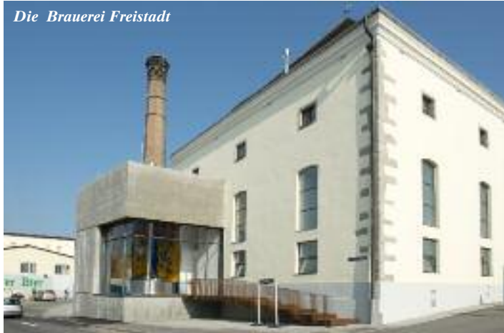
Die Brauerei Freistadt

Vier Ausstellungsorte dies- und jenseits der heutigen Grenze laden zu einer multikulturellen Entdeckungsreise in Oberösterreich und Südböhmen ein. Dabei öffnen Freistadt, Bad Leonfelden, Vyšší Brod und Český Krumlov ihre Schatztruhen mit bedeutsamen Originalen, die spannend im Kontext inszeniert werden.