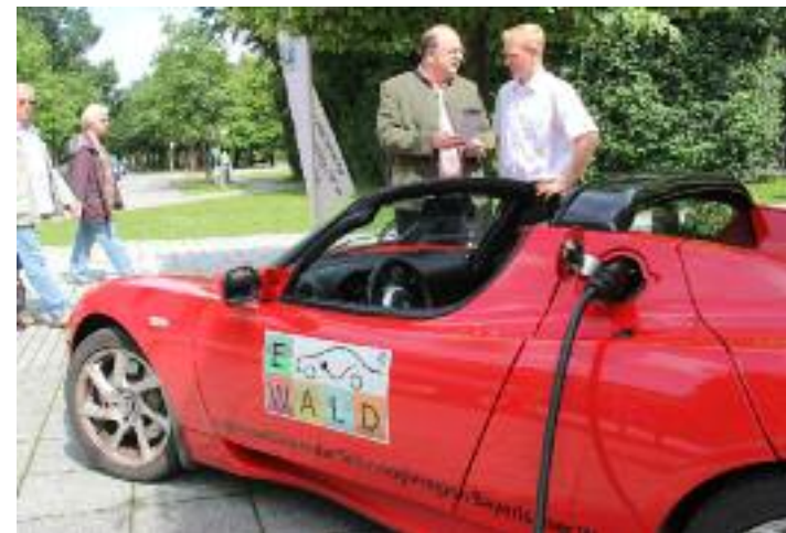
Die jährlichen E-Mobilitätstage sind ein Highlight in Bad Füssing. Der Termin der E-Mobilitäts-Tage 2013 sind der 11. und 12. Juni. Highlight der Fahrzeugschau ist in diesem Jahr eines der schnellsten E-Autos der Welt, der Tesla Roadstar.