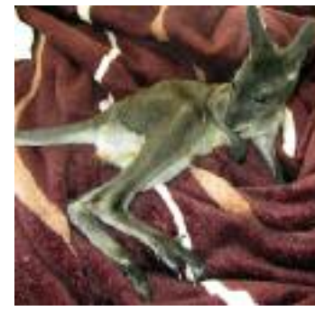
Mit besonders süßem Nachwuchs lockt der Vogel- und Tierpark Irgenöd zwischen Passau und Vilshofen seine Besucher in der aktuellen Saison. Erst kürzlich hat dort Känguru-Baby „Emil“ das Licht der Welt erblickt.

Im Nationalpark Bayerischer Wald bei Ludwigsthal und Neuschönau gehören Luchse, Bären und Wölfe zu den Attraktionen der Tierfreigelände. Dort erhalten Gäste auf Rundwegen und Aussichtstürmen völlig kostenfrei spannende Einblicke in die Tierwelt der Region. Die zugehörigen Natur-Informationszentren bieten vertiefende Informationen.