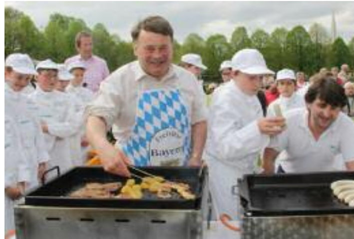
Der bayerische Landwirtschaftsminister als Grillmeister.

Halmstein 7 · D-94094 Malching · Tel. 00 49 (0) 85 73 / 6 87 · Fax 9 69 99 15