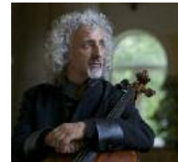
12. Juli: Mischa Maisky

Alle Informationen zu den Festspielen und das gesamte Programm der 61. Europäischen Wochen finden Sie hier: www.ew-passau.de