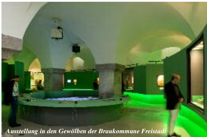
Ausstellung in den Gewölben der Braukommune Freistadt

Infos und Führungsanmeldungen zur Landesausstellung: Tel.: +43/720 300 305, www.landesausstellung.com