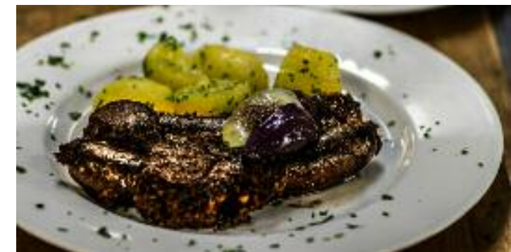
Für seine Blunzn wurde der Gasthof Haudum bei der Blutwurst-WM in Frankreich mit Gold und Bronze ausgezeichnet.

Gasthof Haudum Rohrbacher Straße 2 4184 Helfenberg www.haudum.at, www.speck-shop.at