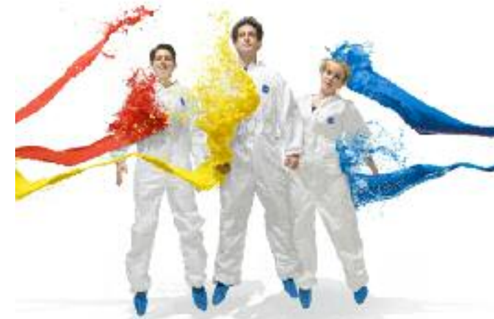
14. Juli: Fresco Trio