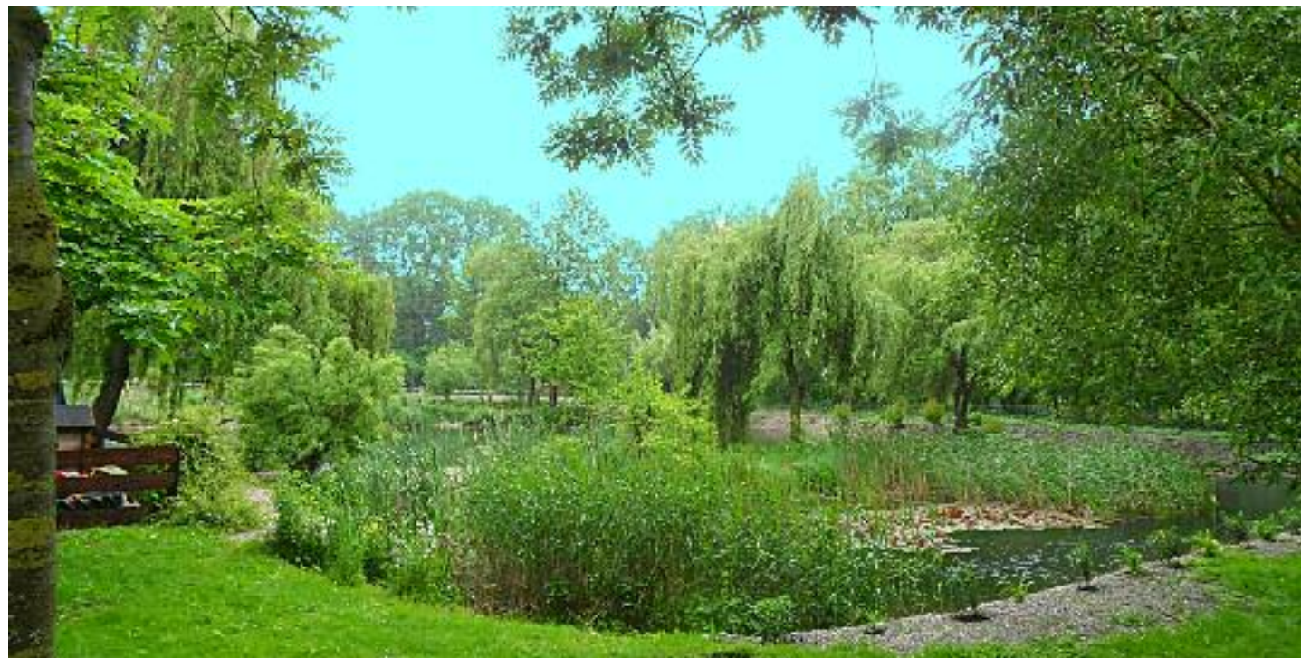
Einen Augartenweg mit heimischen Pflanzen erlebt man auf den Spazierwegen um die alten Fischteiche beim Fischerwirt in Mooshaus bei Hartkirchen. Hunderte verschiedener Wasser-, Sumpf- und Wiesenpflanzen gedeihen hier unter den alten Weiden.

Der neue Augarten ist aus Sicherheitsgründen von Mittwoch bis Sonntag nur stundenweise geöffnet. Kinder haben nur in Begleitung Erwachsener Zutritt.