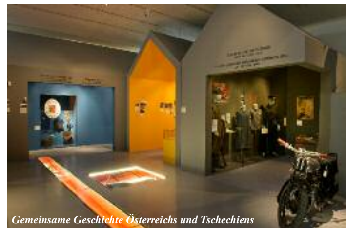
Gemeinsame Geschichte Österreichs und Tschechiens