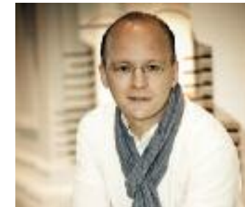
13. Juli: Hansjörg Albrecht