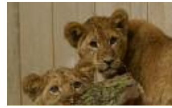
Zu den tierischen „Stars“ der neuen Wildpark-Saison gehören die rund neun Monate jungen Löwen-Babys „Shari“ und „Kiano“ aus Ostbayerns größtem Tierpark im niederbayerischen Straubing.