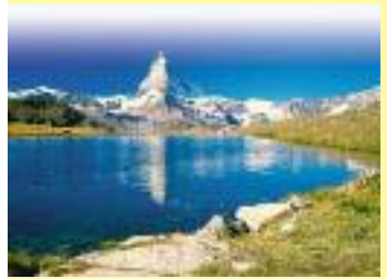
Alpenlandschaft am Matterhorn

Wer noch mehr Höhepunkte und Sehenswürdigkeiten der Schweiz entdecken möchte, für den ist die 6-Tage-Reise „Schweiz mit Matterhorn“ genau richtig. Von der berühmten Via Mala Schlucht über Davos, einer Fahrt auf den Spuren des Gletscher-Express bis zu einem Ausflug zum Matterhorn erleben Sie die Perlen der Schweiz. Über den Genfersee und Montreux führt die Heimreise über Interlaken und Luzern am Vierwaldstättersee noch vorbei am Bodensee. Klosterhuber-Reisen führt diese 6-tägige Schweiz-Reise am 13.7. und am 10.8. mit einem ausgezeichneten